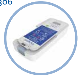
Inogen One G5 Líþíum rafhlaða* Allt að 6,5 klst. endingartími Íhlutur #BA-500