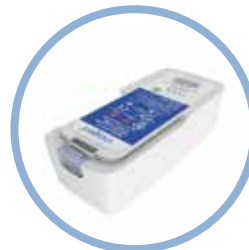
Inogen One®G5 Litiumionbatteri med forlænget levetid** Op til 13 timers driftstid Varenr. BA-516