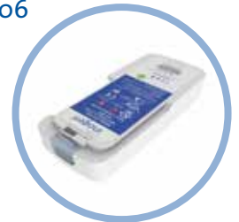
Inogen One G5 Litiumionbatteri* Op til 6,5 time driftstid Varenr. BA-500