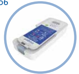
Inogen One G5 Oplaadbare lithium-ion batterij* Batterijduur tot 6,5 uur Item #BA-500