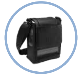
Inogen One G5 Sacoche de transport* Réf. article CA-500