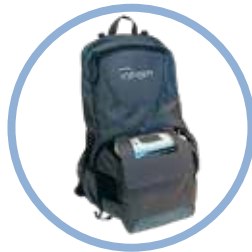
Inogen One G5 Sac à dos** Réf. article CA-550