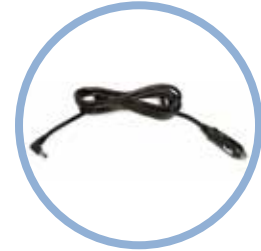
Inogen One G5 Câble d'alimentation CC* Réf. article BA-306