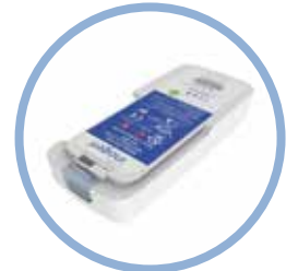
Batería de iones de litio del Inogen One G5* Hasta 6,5 horas de funcionamiento Modelo n.º BA-500