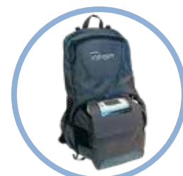
Mochila del Inogen One G5** Modelo n.º CA-550