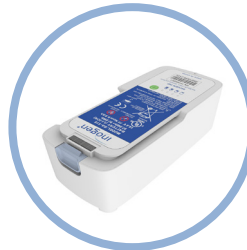
Inogen One G5 Pitkäikäinen litiumioniakku** Toiminta-aika jopa 13 tuntia Pos. BA-516