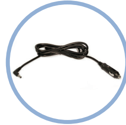
Inogen One G5 Tasavirtakaapeli* Pos. BA-306