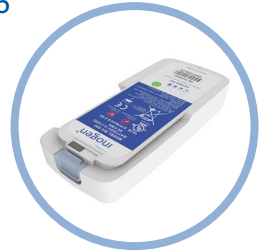
Inogen One G5 Litiumioniakku* Toiminta-aika jopa 6,5 tuntia Pos. BA-500