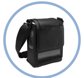
Inogen One G5 Kantolaukku* Pos. CA-500