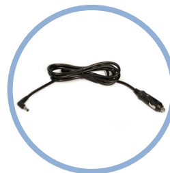
Inogen One G5 Likestrømsledning* Artikkel #BA-306