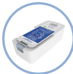
Inogen One ® G5 Litium ionbatteri med utvidet driftstid** Opp mot 13 timer driftstid Artikkel #BA-516