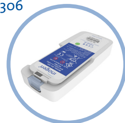
Inogen One G5 Litium ionbatteri* Opp mot 6,5 timer driftstid Artikkel #BA-500