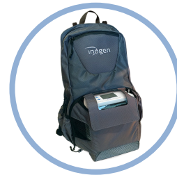
Inogen One G5 Ryggsekk** Artikkel #CA-550