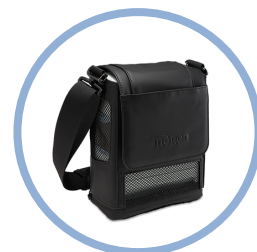
Inogen One G5 Bæreseske* Artikkel #CA-500