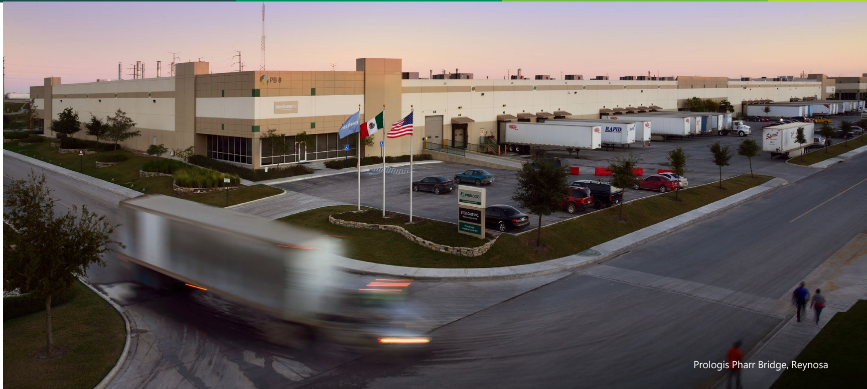
Prologis Pharr Bridge, Reynosa

IV. Propuesta, discusión y, en su caso, ratificación y/o designación de Miembros Independientes propietarios y/o suplentes del Comité Técnico, así como, en su caso, calificación o confirmación de su independencia de conformidad con los términos establecidos en la Cláusula 5.2, inciso (b), numeral (ii) y demás aplicables del Contrato de Fideicomiso. Acciones y resoluciones al respecto.