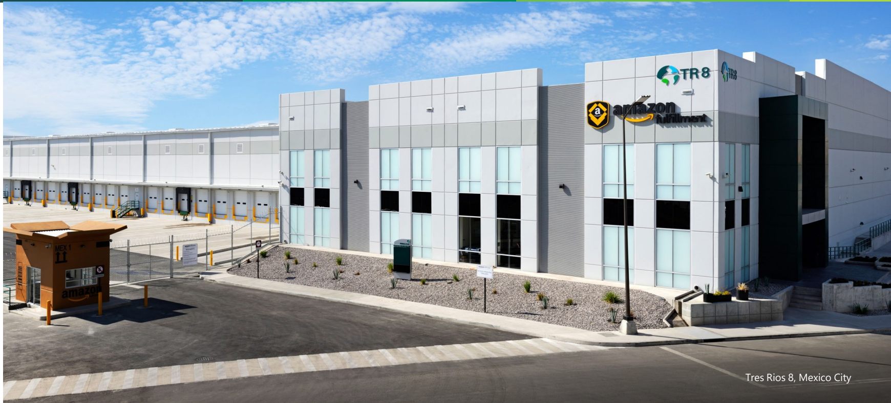
Tres Rios 8, Mexico City