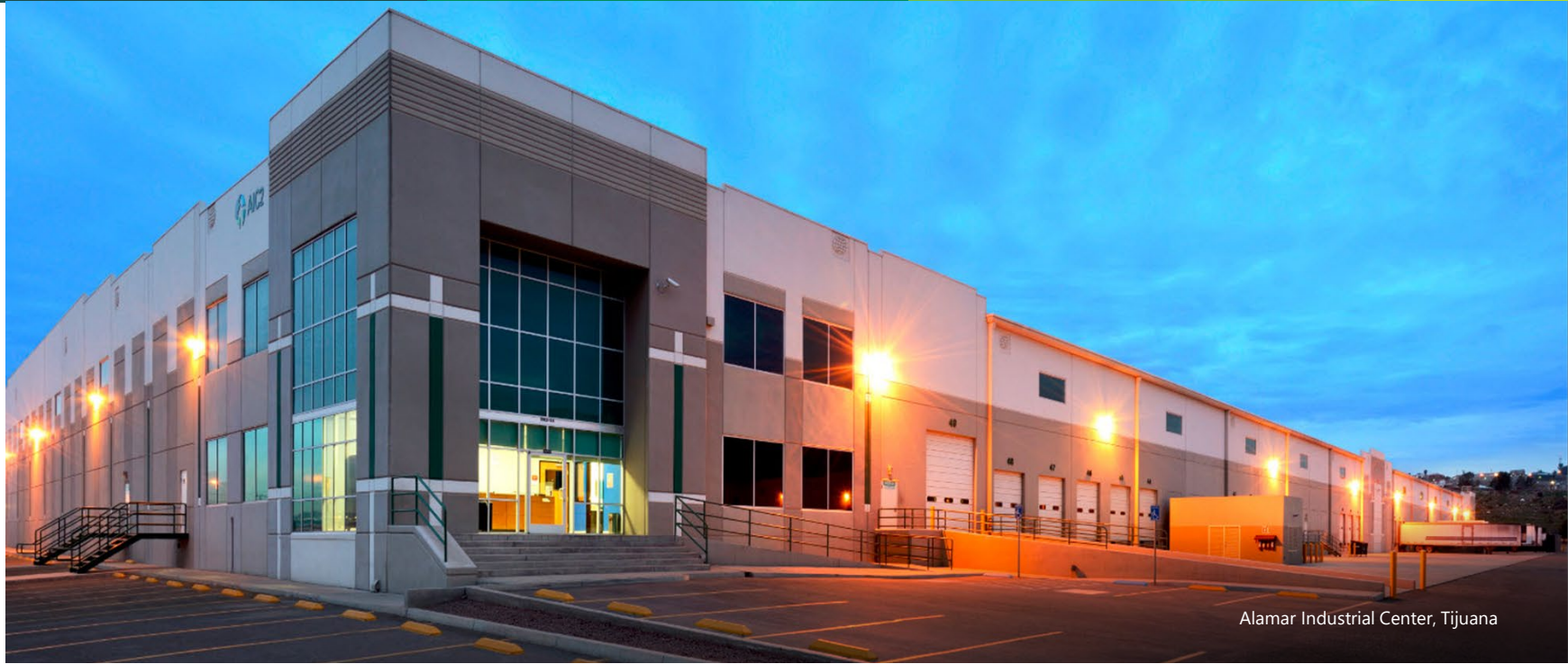
Alamar Industrial Center, Tijuana

III. Propuesta, discusión y, en su caso, aprobación para instruir al Fiduciario y al Representante Común, en la medida que a cada uno corresponda, a realizar los actos necesarios y/o convenientes para cumplir con las resoluciones adoptadas en la Asamblea, sin limitación, celebrar todos los documentos y llevar a cabo todos los procedimientos, publicaciones y/o comunicados que sean necesarios y/o convenientes, en relación con lo anterior. Acciones y resoluciones al respecto.