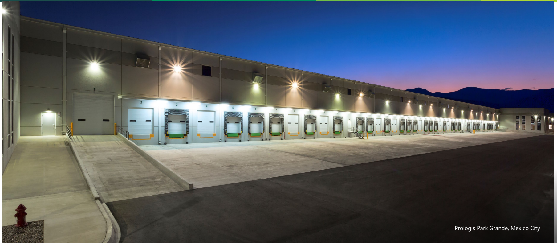
Prologis Park Grande, Mexico City