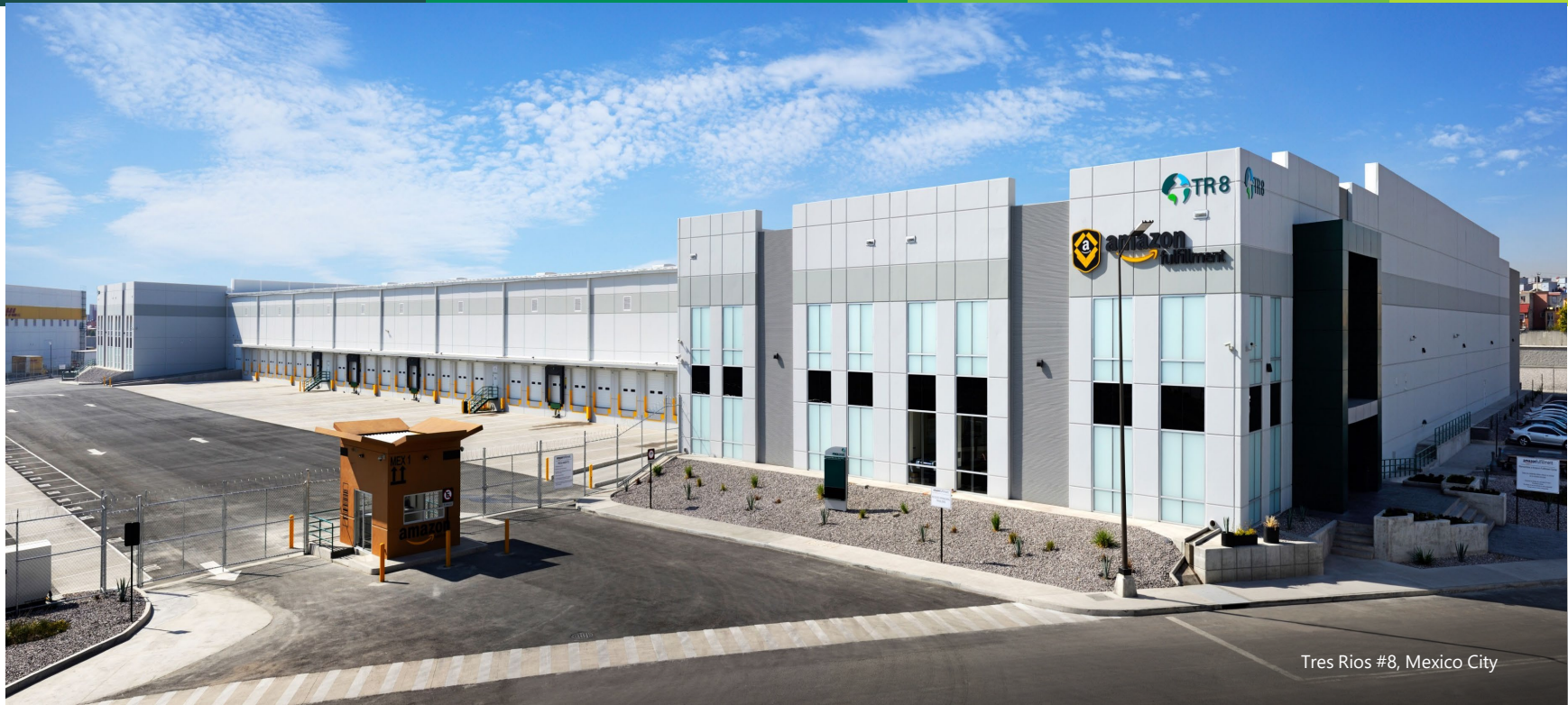
Tres Rios #8, Mexico City

v. Propuesta, discusión y, en su caso, ratificación de la remuneración de los Miembros Independientes propietarios y/o suplentes del Comité Técnico, de conformidad con los términos establecidos en la Cláusula 5.3 y demás aplicables del Contrato de Fideicomiso. Acciones y resoluciones al respecto.