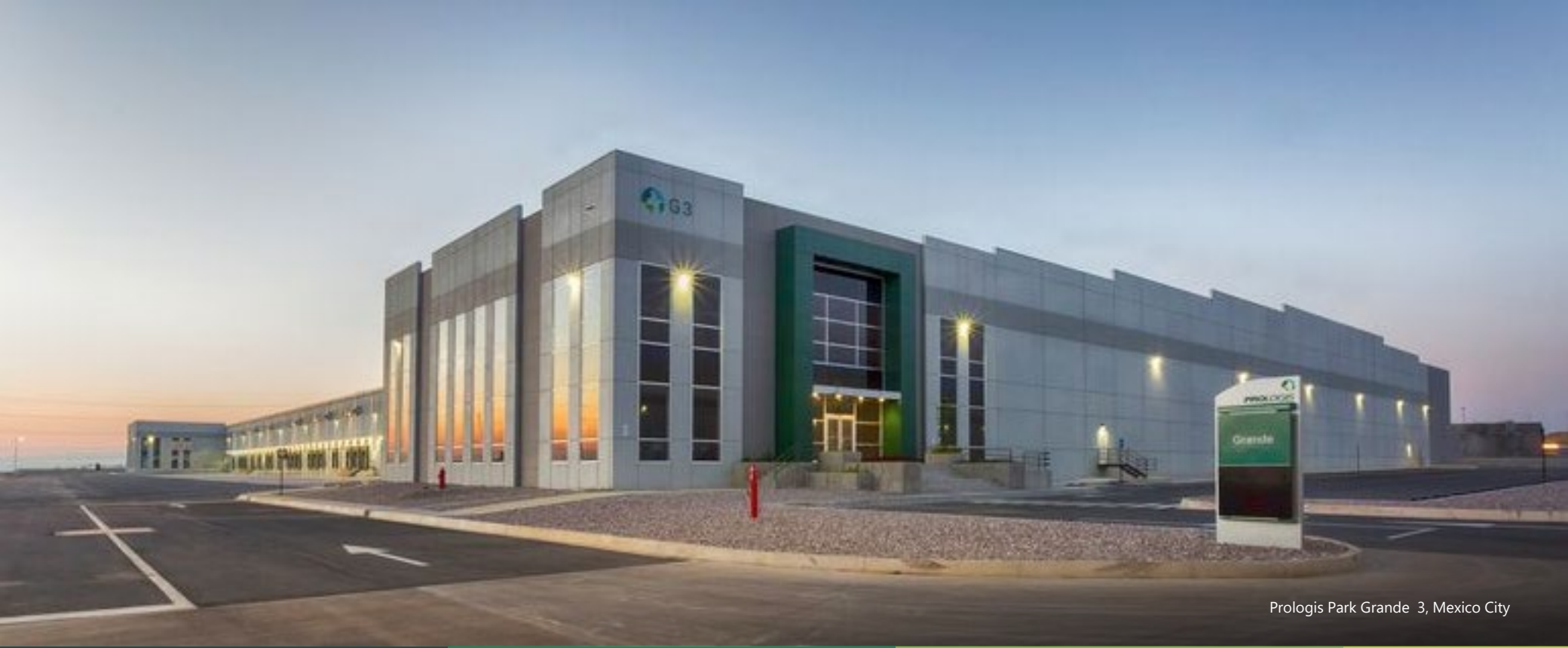
Prologis Park Grande 3, Mexico City